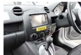
全面禁煙に先立ち禁煙化された社用車。「禁煙車」のステッカーが貼られる