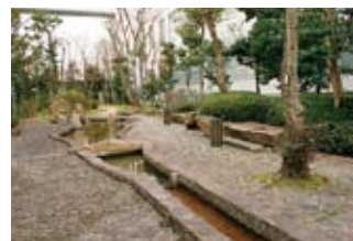
中庭に設けられた喫煙所。今後は非喫煙者の通行が多い喫煙所を廃止し、建物から離れた場所に集約することも検討中