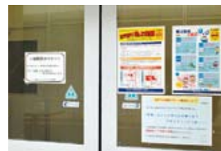
喫煙所には、喫煙マナーに関する注意書き、啓発のチラシで、路上喫煙の防止や非喫煙者への心配りを訴える