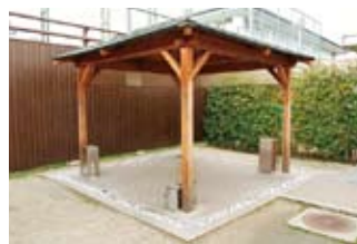
東屋風の屋外喫煙所。平成20年度に設置場所を検討したうえで予算化し、全面禁煙に合わせ完成させた。敷地内にはこの喫煙所を含め、屋外喫煙所が数カ所設置されている

ここでは全面禁煙へ移行した事業場の例をご紹介します。敷地内に事務棟や工場が点在するこの事業場では、平成21年10月1日付で建物の各フロアに設置されていた喫煙スペースを廃止、喫煙は屋外と建物屋上の喫煙所に限定する、全面禁煙に踏み切りました。それに先立ち、平成19年度以降、社用車の禁煙化、たばこ自販機の撤去などハード面の対策と並行して、禁煙教室の定期的な実施、産業医による禁煙相談、ニコチンパッチの無料配布など禁煙支援活動も積極的に展開、その結果平成19年度には26.8%だった喫煙率が、平成22年度には20.2%へと減少しました。喫煙者に対し受動/能動喫煙の害を周知し、意識改革・行動変容へと結び付けたことが、成功の秘訣といえそうです。