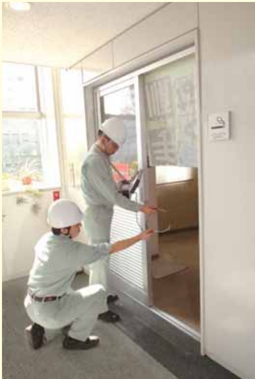
喫煙室入り口の気流の風速の測定

給気がないと排気できません。そのため喫煙室に煙がこもります。出入口などから必要な給気を確保しましょう。出入口にドアを設ける場合は、ガラリ（空気を取り入れるためにドアや壁に設けられた開口部）を設け、給気を確保しましょう。