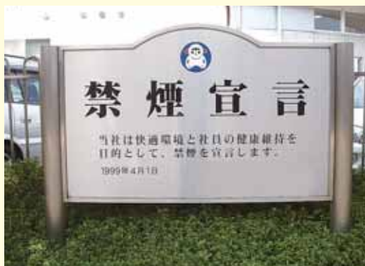
禁煙事業場のモニュメント

職場における喫煙対策を実効あるものとするためには、事業者が労働衛生管理の一環として組織的に取り組む必要があることから、その進め方について衛生委員会等で検討し、全員の参加の下で喫煙対策を確実に推進する必要があります。