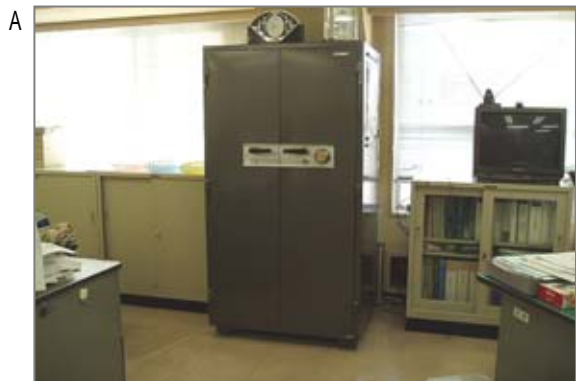
【概要】金庫はその性能要求のひとつとして火災から内容物を守るために外皮は二重構造になっており、その間に石綿含有の断熱材が張られているものがあります(耐火金庫)。