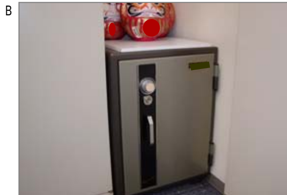
石綿を使用した耐火金庫の製造・補修時に石綿にばく露する可能性があります。解体時にも飛散・ばく露の可能性があります。