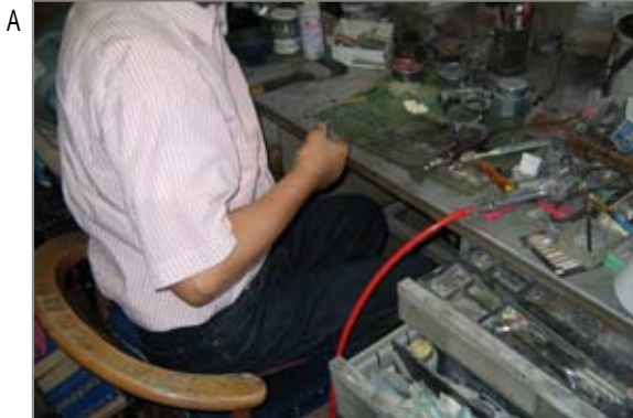
A 歯科技工の作業台。作業室は比較的狭い空間で行われます。部屋には歯のつめものやブリッジ等を製作する様々な器具が置かれています。作業台はその中心です。