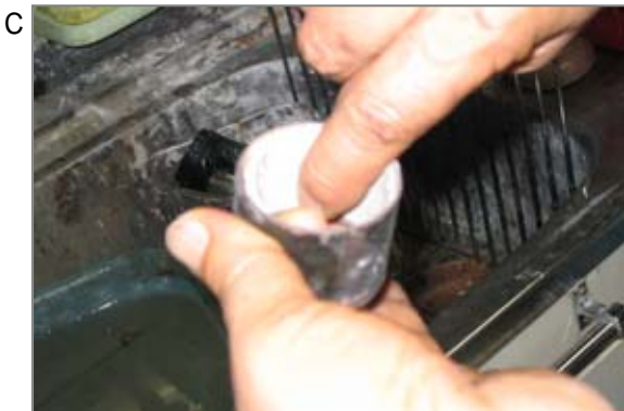
C 石綿リボン作業。歯科技工の作業では石綿リボンをよく使っていました。写真は歯のつめもの作成の際に使用する筒(リング)の内部に石綿リボンを貼り付けているところです。