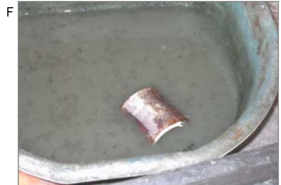
F 炉から取り出した筒と歯(リング)のつめものを外す水洗い場。筒(リング)とボロボロになった石綿リボンが残り、それを水洗します。水洗い場の周囲には粉じんが乾燥して白い粉としてこびりついています。