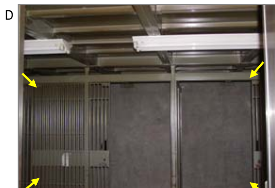
金庫室に吹きつけられた石綿。特定の行員が一日数回程度、出入りしたと思われます。吹きつけの劣化や損傷により、ばく露した可能性があります。