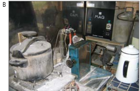
B 作業室イメージ。歯科技工の作業は歯科技工士だけではなく歯科医も行ってきた作業です。石綿リボンの使用、電気炉での石綿使用などがあります。