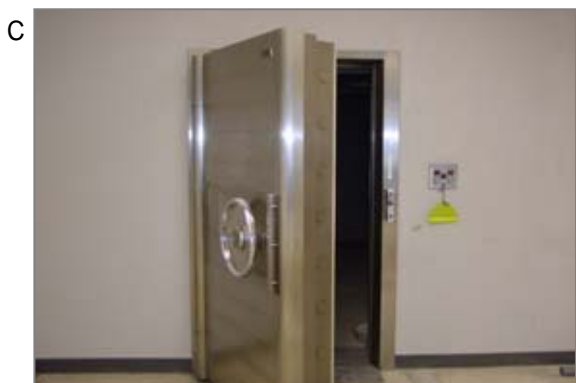
銀行の金庫。湿気を嫌っての調湿効果目的(湿気を吸ったり吐いたりする)で、金融関係の金庫室の天井には吹きつけ石綿が施工されていたケースが多い。対策工事は殆ど終了しています。