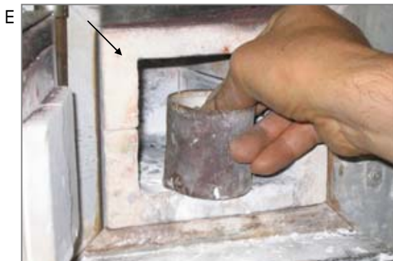
E 歯のつめもの作成のために電気炉に歯のつめものと型をいれた筒(リング)を入れるところ。電気炉の周囲に断熱材として石綿が使用されているのが見えます。炉の開閉の際に石綿が飛散した可能性があります。