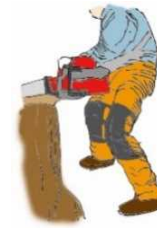
（図1）下肢の切創防止用保護衣

次の保護具等の選定に当たっては、防護性能が高いことはもちろんのこと、作業性が良く、視認性の高い目立つ色合いのものであって、人間工学に配慮した使いやすい機能を備えたものを選定すること。（① 下肢の切創防止用保護衣 （図1）、②衣服、③手袋、④安全靴等の履物、⑤保護帽、保護網・保護眼鏡及び防音保護具）